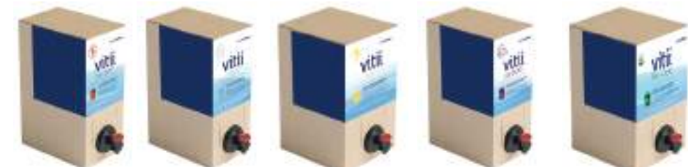
Vitii Bacteri 5L